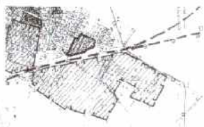
WYRYS ZE STUDIUM GMINY DREZDENKO