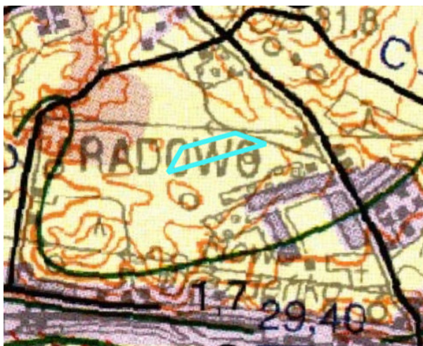
— granica obszaru objętego projektem planu