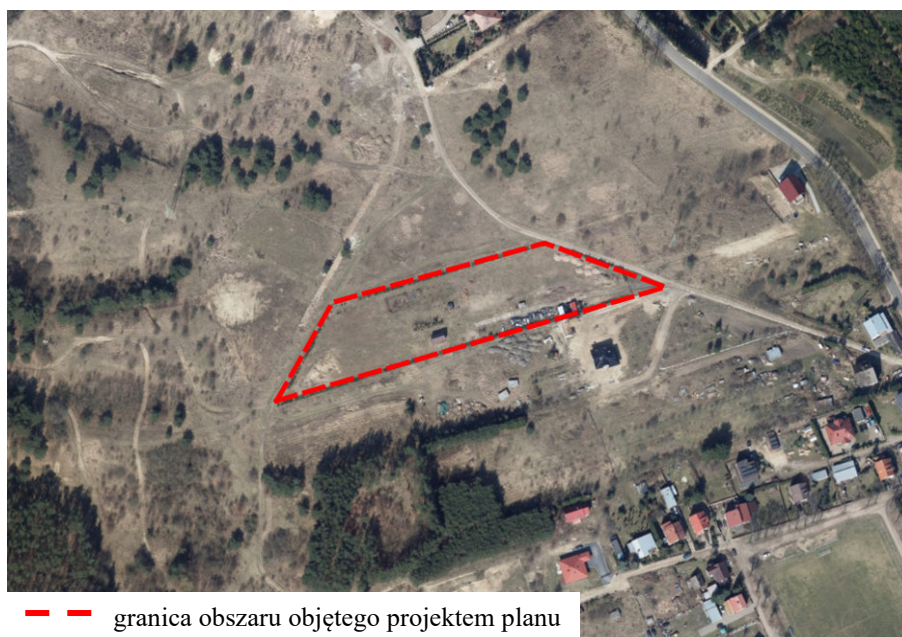
Ryc. 1. Lokalizacja obszaru objętego projektem planu na tle ortofotomapy

Obszar objęty opracowaniem zlokalizowany jest w miejscowości Radowo, w rejonie ulic: Radosnej i Widokowej. Jego powierzchnia wynosi ok. 0,9 ha. Przedmiotowy teren jest niezainwestowany (Ryc. 1.). W ciągach dróg sąsiadujących z obszarem opracowania funkcjonuje sieć wodociągowa. Brak sieci kanalizacji sanitarnej. W sąsiedztwie przedmiotowego terenu przebiega napowietrzna linia elektroenergetyczna wysokiego napięcia 110 kV. Obszar objęty opracowaniem zlokalizowany jest w sąsiedztwie terenów zabudowy mieszkaniowej jednorodzinnej, terenów lasu oraz nieużytków.