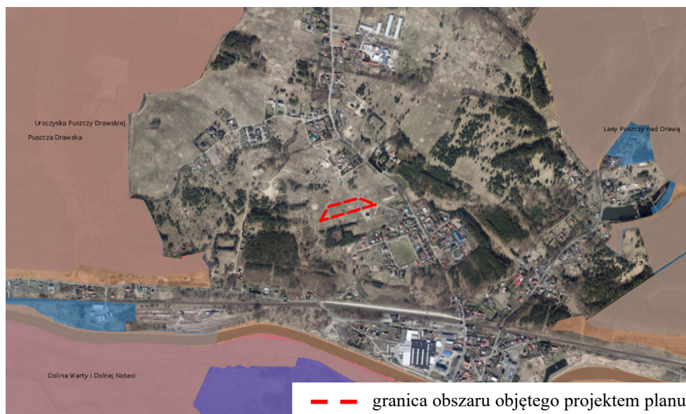
Ryc. 4. Lokalizacja obszaru objętego projektem planu na tle obszarów chronionych

Teren objęty projektem planu położony jest poza granicami obszarów chronionych na podstawie ustawy z dnia 16 kwietnia 2004 r. o ochronie przyrody (Ryc. 4).